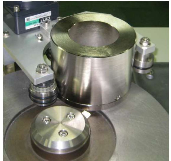
スカ이프修正装置装着例（別売）

■単結晶ダイヤモンドバイトのすくい面及び逃げ面の再研磨加工は初心者でも加工できます。