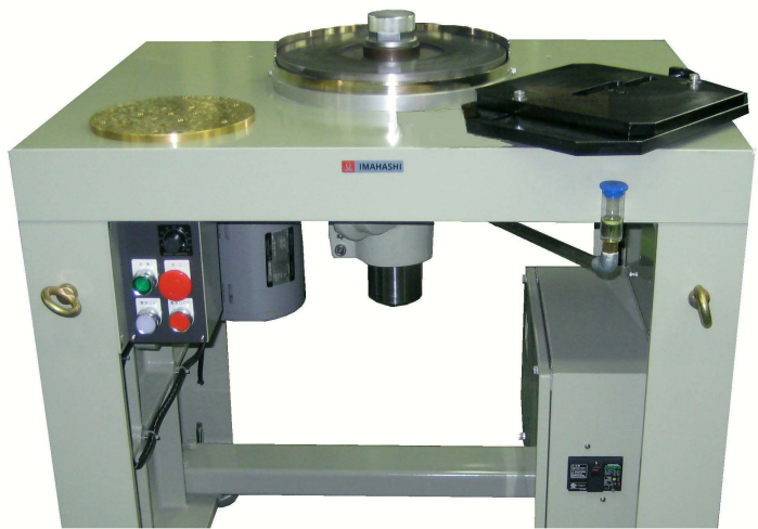
DPB-3型の改造型仕様例