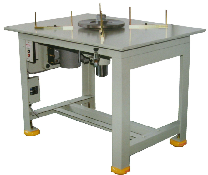
溶接構造フレームのDPB-1型