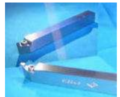
加工したダイヤモンドバイト