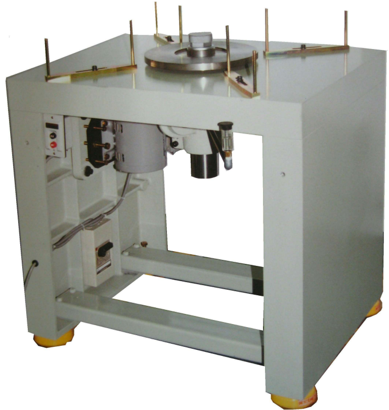
鋳鉄製フレームのDPB-3型

スカ이프上面は高速回転でも極めてフレが小さく、単結晶ダイヤモンドバイト刃先の正確な面加工や刃付けができます。