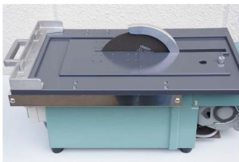
右横より本体を見たところ