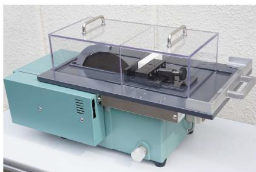
専用前後カバーによるオールカバー