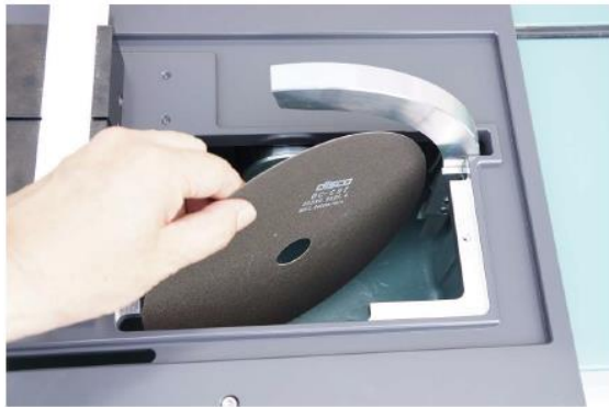
砥石交換（専用バイス装着時）