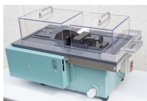
長尺試料加工時の前後カバー