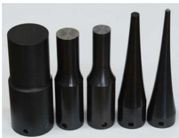
加工用ホーン各種