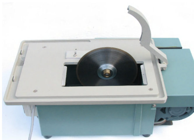
ブレード交換用フタを開けたところ TS-200, TS-200P2